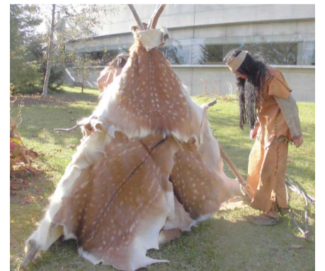
鹿の革で覆われたテント