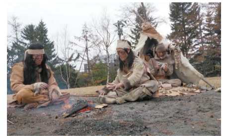
火をおこしたり、石器づくりに没頭している

彼らとの出会いは、石器や解説パネルだけでは伝わらない、当時の生活のようすを多くの来館者に知っていただく良い機会になっています。