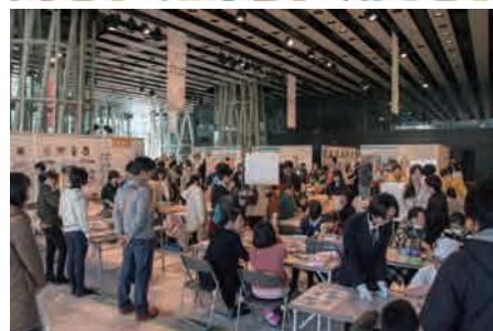
※写真は昨年の様子です