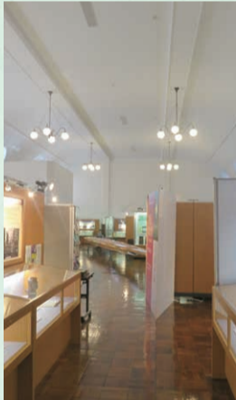
展示室は柱がなく、天井が高いのが特徴的