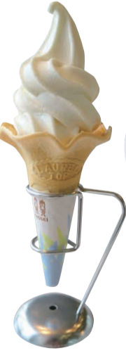
▲ソフトクリーム 300円