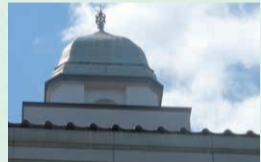
ベル型で銅板葺きのシンボリックな塔屋

瓦葺の屋根にロマネスク調のデザインは大正後期に造られた大学施設としては意匠的にも珍しい。キャンパス内に残る旧仙台医学専門学校六号教室(魯迅の階段教室)などとともに登録有形文化財になっています。