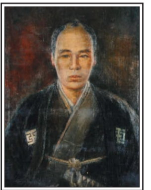
玉蟲左太夫画像 仙台市博物館蔵

仙台藩士・玉蟲伸茂の7男として、北五番丁で誕生。13歳で養子となるが、学問を志して24歳の時に江戸へ。幕府の儒学者である林復齋の私塾へ入った後、仙台藩江戸藩邸の学問所・順造館の講師に迎えられた。戊辰戦争では東北諸藩をまわり、奥羽越列藩同盟の成立に尽力。仙台藩の降伏後捕えられ、牢前で切腹を命じられる。