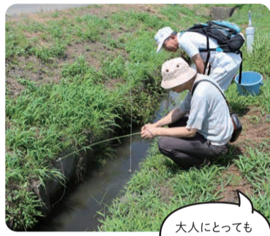
大人にとっても遊び場です!

これからのイベント 9月4日(火)～1月14日(月・祝) せんだい3.11メモリアル交流館を囲む風土展#3「竹であそぶ」