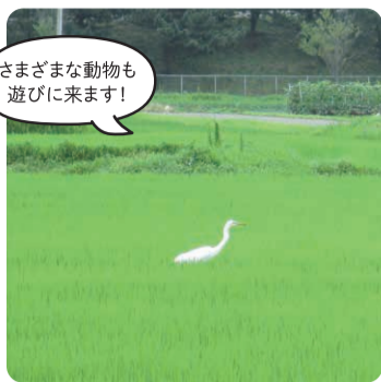
さまざまな動物も遊びに来ます!

交流館が建つ仙台東部沿岸地域の良いところは、四季がはっきりと感じられるところです。事務室の窓から見える田んぼの風景も季節ごとにさまざま、何やら面白いことをしている人を見かけると、思わず事務室を飛び出して話しかけてしまいます(笑)。春が近づくと、足元の雑草が色づきはじめます。じっくりと観察している方がいたので話しかけたところ、「足が悪くなった母の代わりに」と、草餅を作るためのヨモギを見極めながらあぜ道を散策していたのです。暖かくなってくると、田んぼの側を流れる堀は学校帰りの子どもたちの遊び場になり、ランドセルが道路に投げ出されている光景をよく見かけます。92歳のOさんは、自転車に乗って1時間かけてドジョウを取りにやってきます。「どうしてわざわざ?」と尋ねると、「戦地で食べたドジョウ汁が忘れられなくて」とのこと。「買うよりも、自分で捕まえたほうが楽しい」と、手作りの道具で奮闘していました。こうした、この地域の風土とともにある営みとの窓越しの出会いが、交流館に勤める私の楽しみです。