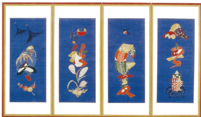
文字入四季四曲屏風 麻 型絵染 1954