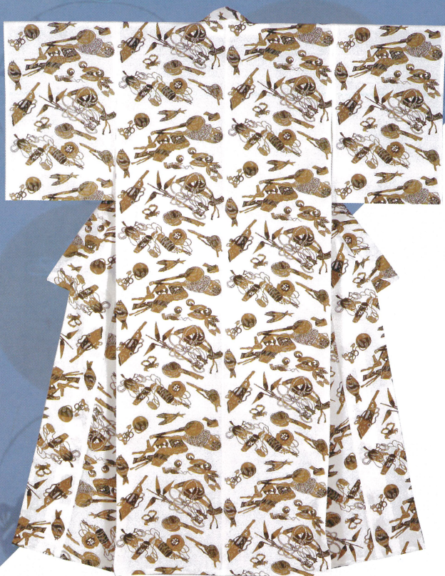
漁具文着物 縮緬 型絵染 1958

染物の世界は心の世界。柳宗悦がうたった言葉「色ソメツ心ソメツ」を、 芹沢銈介が型絵染によって体現させました。動植物、道具、文字などの 多岐にわたる模様、優れた色彩感覚を、屏風やのれん、着物など出品作品 70点を通して、ご堪能ください。