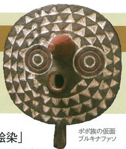
ボゴ族の仮面 フルキナファン