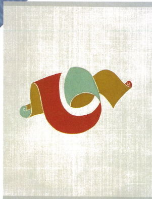
心の字 絹 型絵染 1960