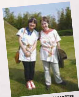
还可以试穿绳文时代的服装。

还有土器和泥偶人制作及引火等其他方面数十间绳文时代相关的手工作坊室。仅想想下次进行什么体验，就令人兴奋不止呦。