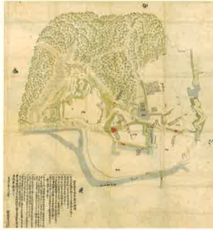
仙名城修復伺絵図 享保6年(1721)11月5日