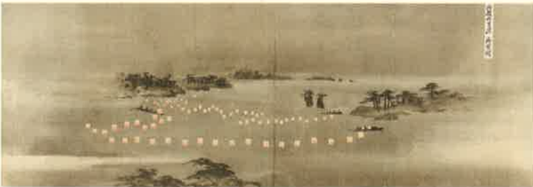
御領内名所国会(松島の灯籠流し) 佐久間晴岳筆 嘉永5年(1852)以降