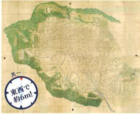
仙名城下五蓋卦(ごりんがけ)絵図 元禄4~5年(1691~92)