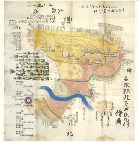
名取郡北方四郎丸村絵図 文政5年(1822)頃

あなたの今いる場所が昔はどんな場所だったか、知りたいと思ったことはありませんか? 仙台市博物館の敷地は、江戸時代には東丸(三の丸)と呼ばれた仙名城の一部で、明治時代には軍隊の敷地となりました。現在も残る土塁や堀(長沼・五色沼)から城の面影を感じることができる場所です。