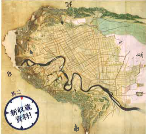
仙名城下絵図 文政3年(1820)頃