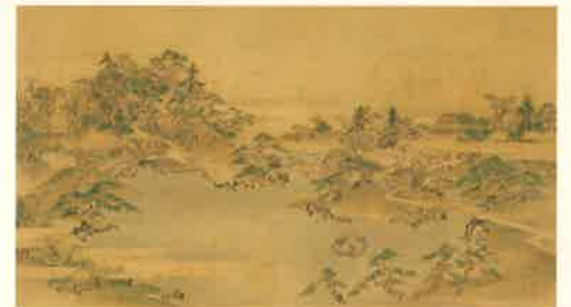
江戸藩邸芝口上屋敷庭園図 菊田伊洲筆 江戸時代後期