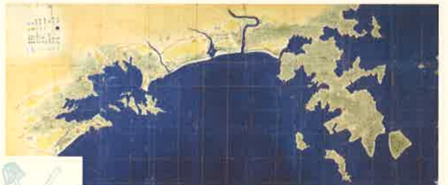
御領分中海岸図 夏 高城・社鹿 嘉永6年(1853)