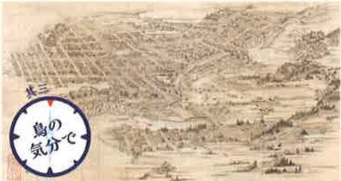
文久二年仙名城下絵図 文久2年(1862)