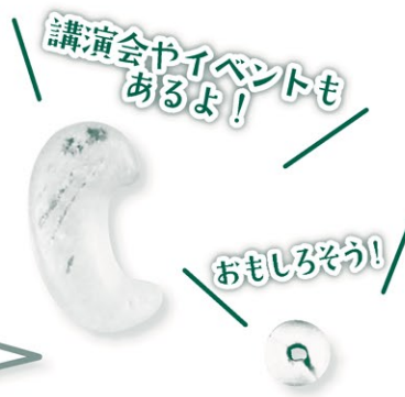
茂ヶ崎横穴墓群出土玉類 (仙台市教育委員会所蔵)

【日時】6月9日(日) 13:30～14:30 【会場】地底の森ミュージアム 研修室 【対象】どなたでも(申込不要) ※入館料が必要です。