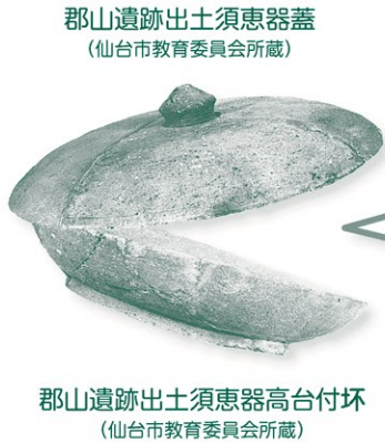
郡山遺跡出土須恵器蓋 (仙台市教育委員会所蔵)

古墳時代の終わりごろから奈良時代にかけて、 陸奥国の中心地として機能した郡山遺跡 (官衙・役所)が仙台平野で見つかっています。 この官衙で、はたらいていた役人や 周りのムラに住んでいた人々はどんな道具を使って くらしていたのか、仙台市内の遺跡からみつかった 道具を中心に紹介します！ さらに最近話題になっている、赤井遺跡(東松島市) や原遺跡(岩沼市)の資料も展示します！