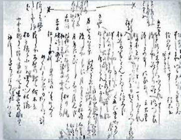
「はて知らずの記」草稿(子規庵保存会蔵)